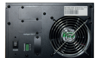
Puertos de Comunicación