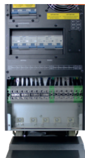
Bypass de Mantenimiento y Borneras