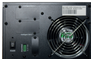
Puertos de Comunicación